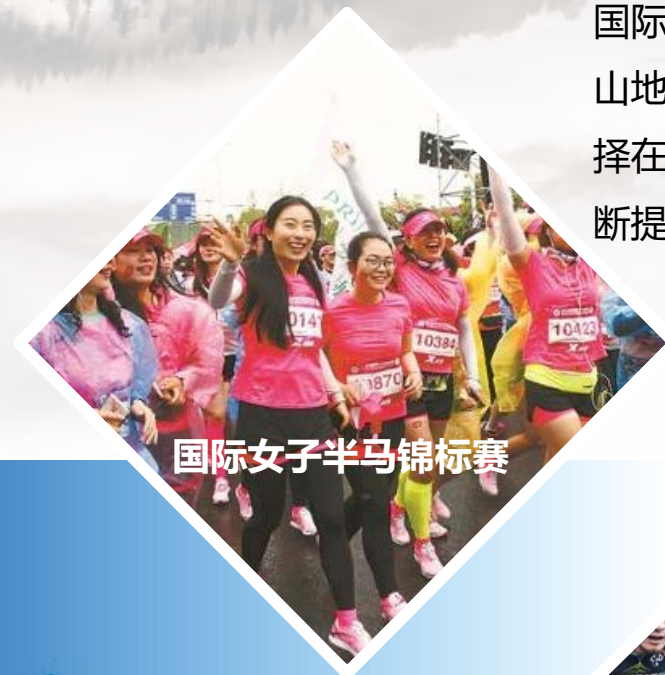
国际女子半马锦标赛

国际女子半马锦标赛、攀岩世界杯、中国山地自行车公开赛等多项高级别赛事也选择在浦口举办，浦口的知名度和影响力不断提升。