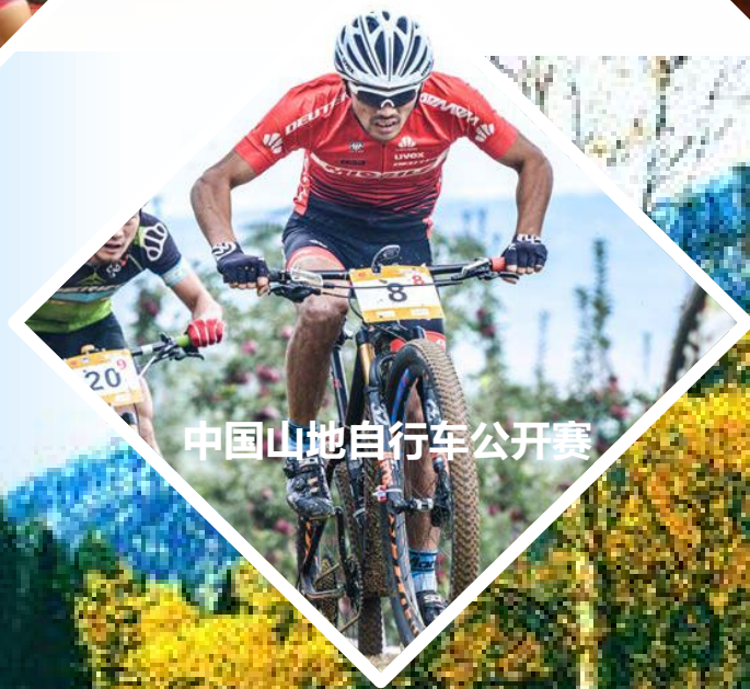
中国山地自行车公开赛