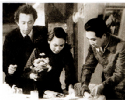
电影《风云儿女》剧照（1935年）