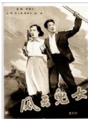
电影《风云儿女》海报（1935年）

《义勇军进行曲》的歌谱寄回上海后，由贺绿汀先生请当时在上海百代唱片公司担任乐队指挥的苏联作曲家阿龙阿甫夏洛莫夫配器，不久就在「风云儿女」中使用。1)