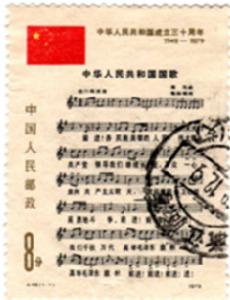
1978年国歌(新词)1979年发行 2)