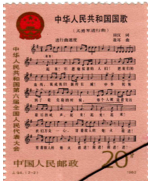
1982年恢复后的《义勇军进行曲》1983年发行 2)