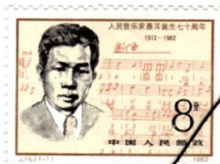
聂耳诞辰 70 周年 1982 年发行 2)

谈起十年内乱的遭遇，夏老的心情沉重。他接着说：“1978年受‘左’的思想的影响，改定国歌歌词，各方面对这一一直有不同意见。这次全民讨论宪法修改草案中，各地各方面要求恢复国歌的原来歌词，确定《义勇军进行曲》为国歌。现在人代会决定恢复国歌原词，意义深长，我举双手赞成！”